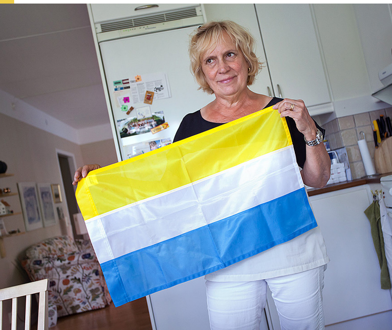
Den tornedalska flaggan är gul - som solen, vit - som snön och blå - som himlen.