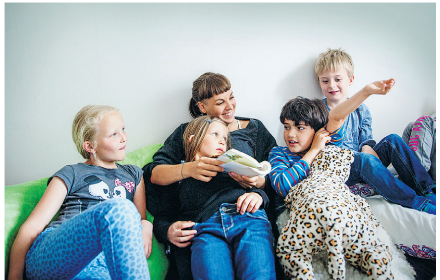
Uppsalan Suomi-koulu med sina 40 deltagare får stöd av Uppsala kommun ur statsbidrag för finskt förvaltningsområde.

Det viktigaste är att vara en träffpunkt där det ges möjlighet att tala finska med jämna åren. Många av barnen har bara en förälder att prata