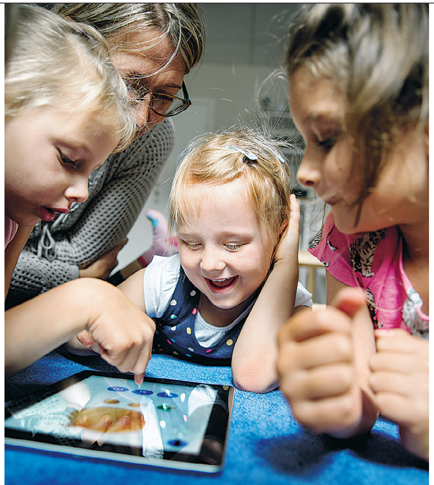
Lärplattor, av typen iPads används nu på förskolan i Huddinge kommun. Ofta sitter flera barn tillsammans. De trycker på bilder varefter det finska ordet dyker upp.